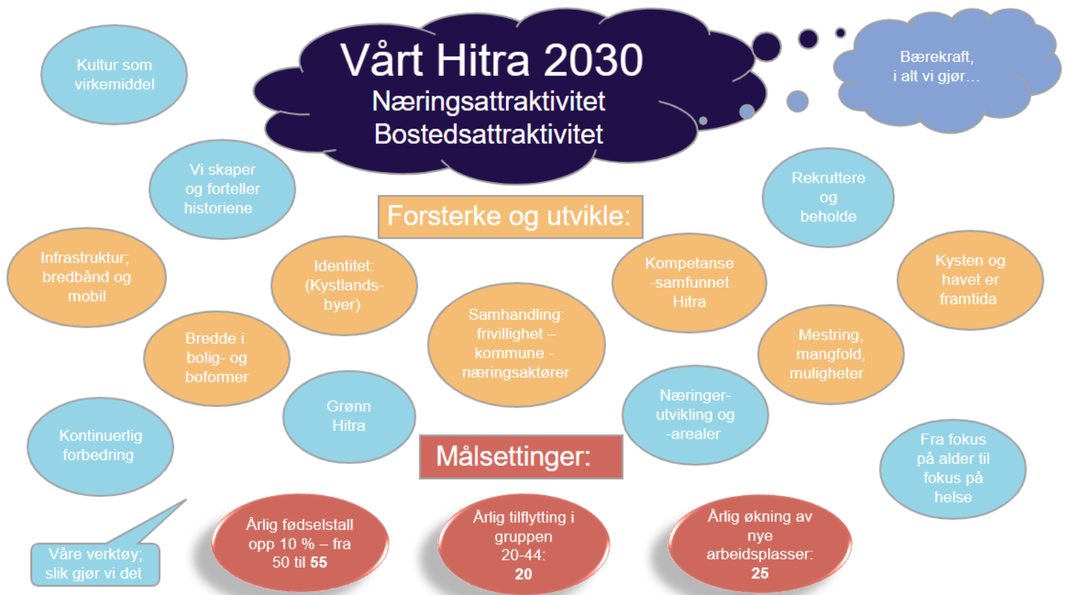
Figur 2 Målbildet Vårt Hitra 2030

Arealplanprosessen skal bygge opp under dette, og være et verktøy for oppnåelse av målsettingene. Figuren under viser målsettinger, fokusområder og verktøy i arbeidet.