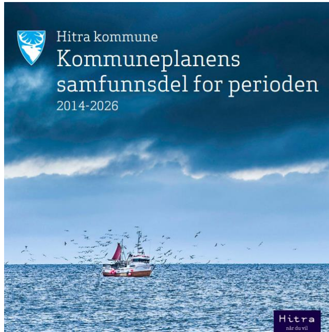
Figur 5 Hitra kommune sin samfunnsplan

Kommuneplanens samfunnsdel er den tekstlige delen av kommuneplanen. Denne trekker opp mål og strategier i et langsiktig perspektiv. Gjeldende samfunnsplan har også klare arealstrategiske mål som bærer relevans i forhold til fremtidsperspektivet. Disse er oppsummert under: