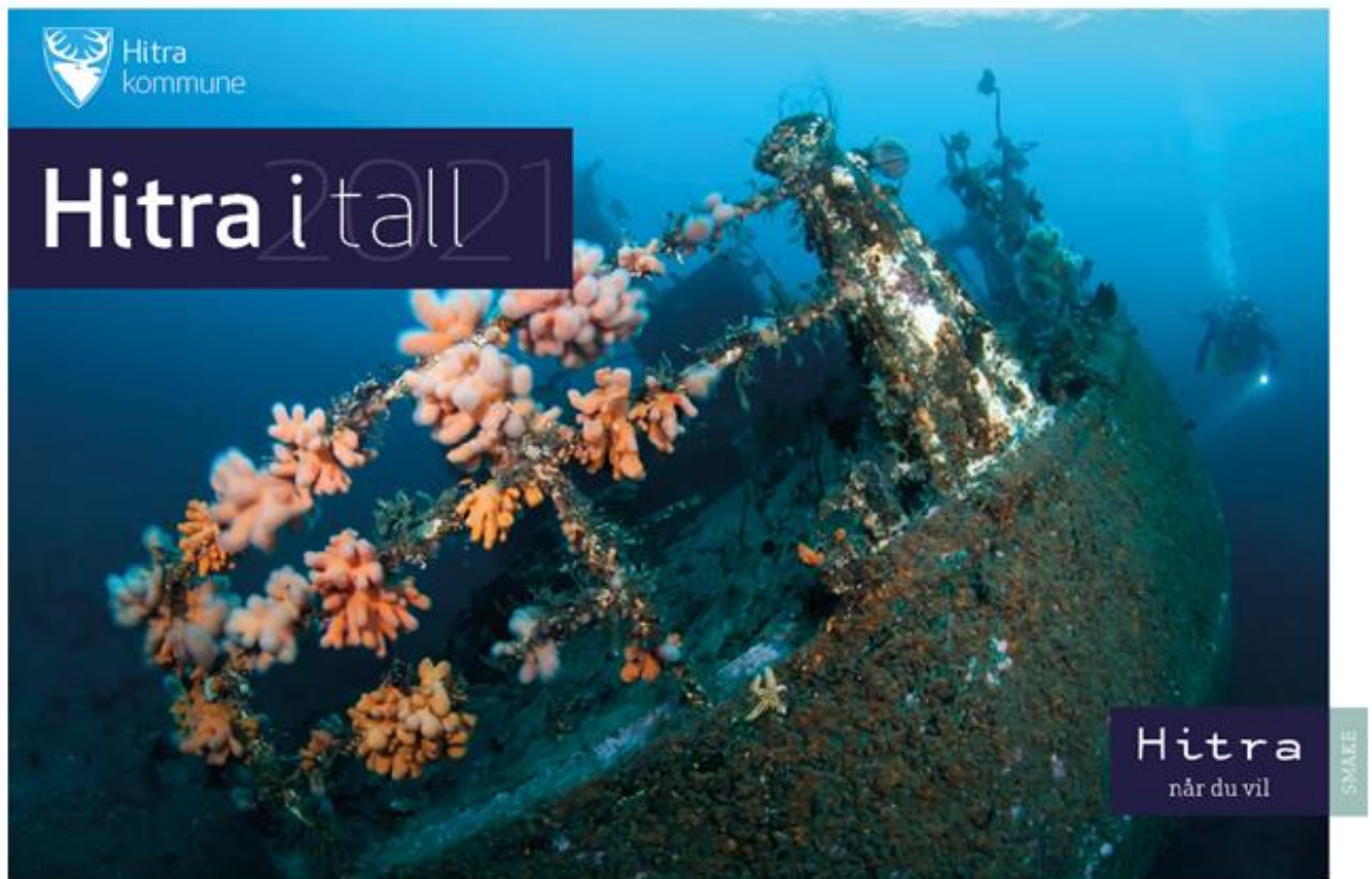
Figur 1 Hitra i Tall 2021

Hitra i Tall er en del av det overordnede kunnskapsgrunnlaget til kommunen, og er grunnlag for arbeidet med overordnet og langsiktig planlegging. Statistikkheftet har som mål å gi overblikk over utviklingstrekk og status for kommunen. Heftet inkluderer en rekke indikatorer for befolkning, skole og utdanning, arbeids- og næringsliv og status for kommunen.