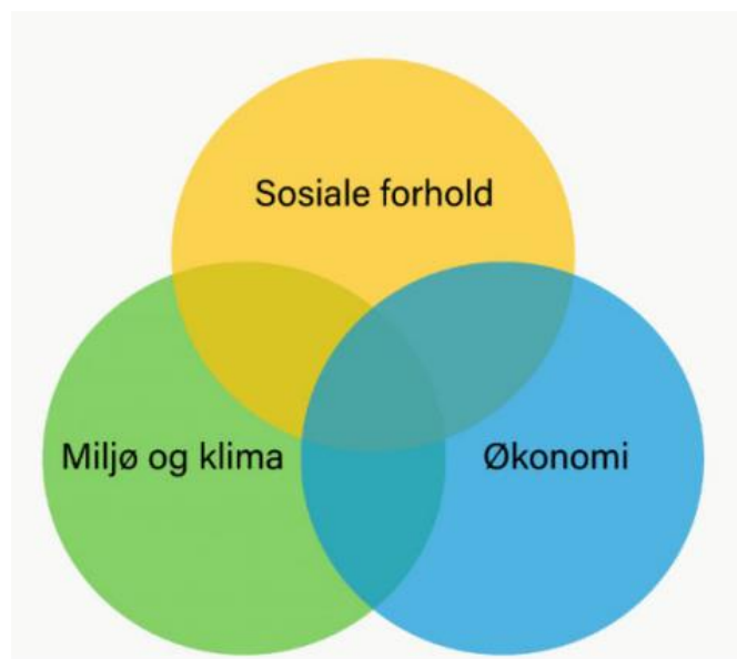
Figur 4 Sammenhengen mellom de tre dimensjonene i bærekraftig utvikling

samfunnsutvikling er en utvikling som imøtekommer dagens behov uten å ødelegge mulighetene for at kommende generasjoner skal få dekket sine behov. For å ivareta en bærekraftig utvikling må det i planarbeid tas hensyn til alle tre bærekraftsområdene; klima og miljø, økonomi og sosiale forhold. I arbeidet med ny arealdel skal vi vektlegge sammenhengen mellom disse tre områdene, og gi tydelig innhold i Hitra kommune sin bærekraft.