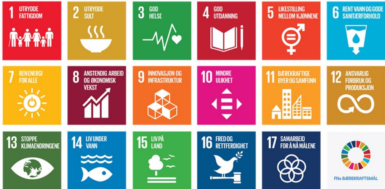
Figur 3 FNs bærekraftsmål

Bærekraftsmålene skal hjelpe oss til å løfte blikket, styre i riktig retning og utvikle gode løsninger lokalt – som også bidrar globalt. Lokal handling er avgjørende for å nå de globale målene.