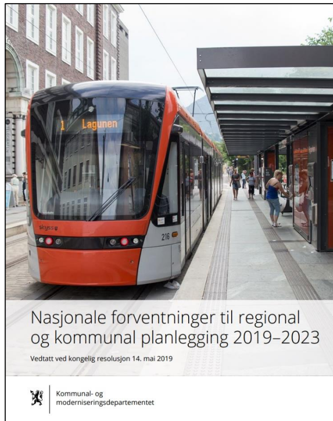
Figur 6 Nasjonale forventninger til regional og kommunal planlegging

For å møte disse utfordringene har regjeringen bestemt at FNs 17 bærekraftsmål skal være det politiske hovedsporet i arbeidet med vår tids utfordringer.