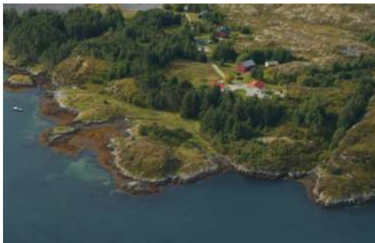
Bildet viser planområdet i 2010

Selve planområdet ligger i et småkupert område ved sjøen. Her er det bergknauser, noe vegetasjon samt tett sitkagran som i sin tid var plantet som vern. I strandsonen er det berg og steiner som er bekledd med tang og tare. Lengre ut i sjø er det registret noe skjellsand.