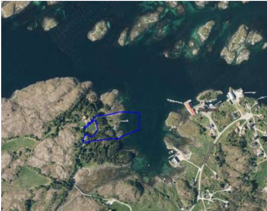
Bildet viser Kvalvikbukta og sjøområdene rundt.

Landskapet rundt planen er et typisk kystlandskap . Her er det holmer og skjær og bergknauser med myr og noe vegetasjon imellom. Området ligger i Kvalvikbukta. Denne bukta er en naturlig havn som er beskyttet av holmer og skjær. Bukta er blitt brukt som havn for båtene helt fra gammelt av.