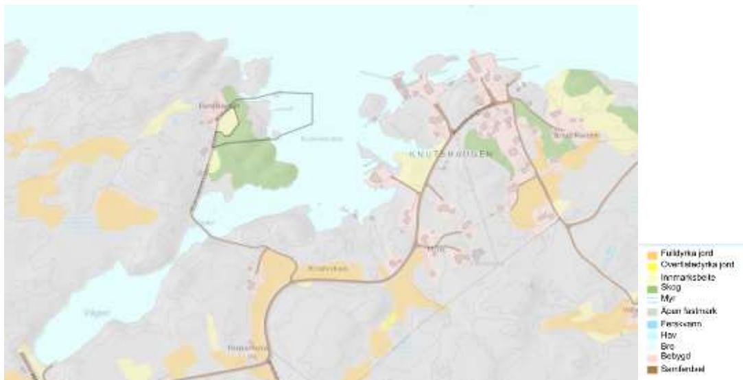
Kartet viser utdrag fra AR5

I området er det registrert noe landbruksareal. Det er ikke registret innenfor planavgrensningen