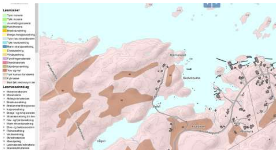
Bilde viser utdrag fra løsmassekartene fra NGU

Området består for det meste av berg og noe myr.