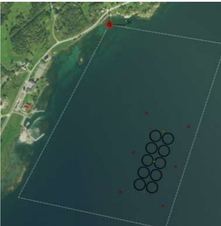
Figur 6 viser illustrasjon av plassering av 10 merder og markeringsbøyer og fortøyningsbøyer med blinkere. (Grimstad og Tønsager AS/Kystbygg AS).

Det er behov for lagring av merder på sjøen. Basert på en alternativsvurdering av det meste egnede området i sjø for mellomlagring av et egnet areal hvor det kan ligge maks 8-10 ferdigproduserte merder, er dette området foreslått lokalisert og regulert øst for Strand.