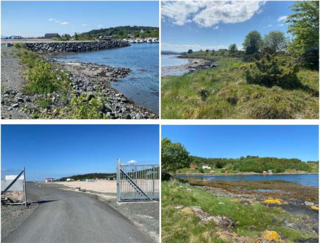
Figur 4 Øverst til venstre: Nordenden av planområdet på Kalvøya sett mot vest med småbåthavna i bakgrunnen. Øverst til høyre: Eksisterende vegetasjonssone/buffersone i øst, sett fra nord mot sør. Nederst til venstre: Industriområdet sett fra vest med Aunøya i bakgrunnen. Nederst til høyre: Utsikt fra nordøstlige del av planområdet mot Sandstad på andre siden av sundet.