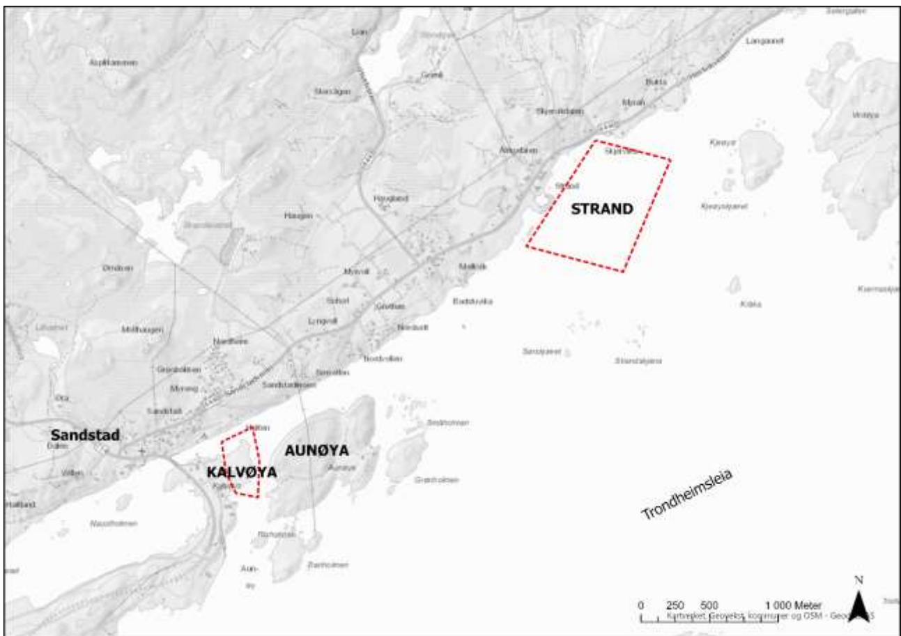
Figur 3: Illustrasjon som viser avgrensning av planområdene som ble varslet ifb med oppstart av planarbeid på Kalvøya og med opplagsområde for mellomlagring av merder utenfor Strand.

Figur 3 viser planområdene som ble kunngjort ifb med oppstart av planarbeid. plassering. Figur 4 viser bilder fra planområdet på Kalvøya.