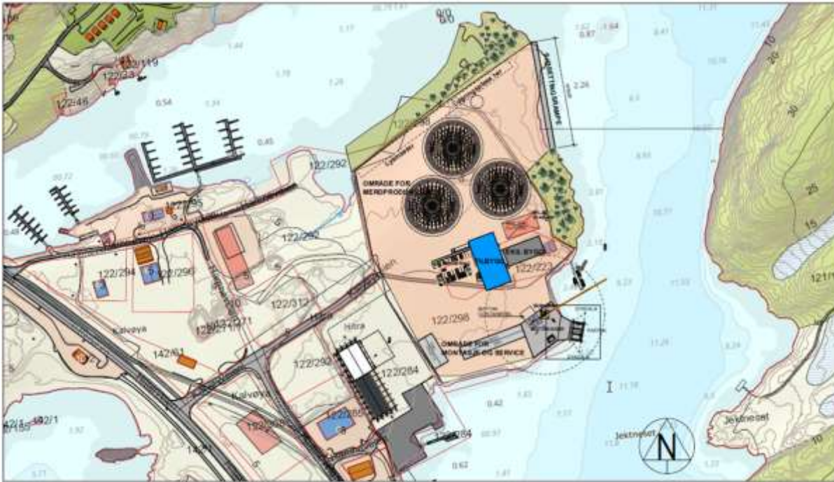
Figur 5 viser illustrasjon av planlagt industriområde på Kalvøya. (Grimstad og Tønsager AS/Kystbygg AS).