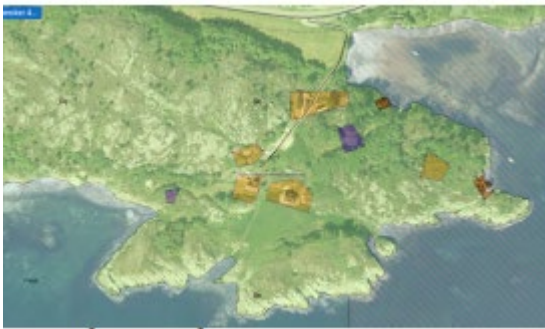
Foreslått formål fritidsbebyggelse

Hele område ligger innenfor 100 metersbeltet i strandsonen og mer enn 5 km til kollektivknutepunkt. Fylkesdirektøren støtter kommunedirektørens innstilling, tiltaket vil føre til at svært få eiendommer vil privatisere et verdifullt område. Fylkesdirektøren anbefaler at innspillet tas ut av planen.