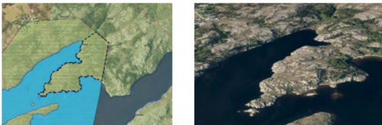
Foreslått formål: bebyggelse og anlegg, fritids- og turistformål

Gjeldende planstatus for området er LNF, området inngår i Strandplan Stene (1978) Det foreslås en rekke tiltak skal bidra til å knytte området nærmere Kvenvær Sentrum, med aktiviteter for både