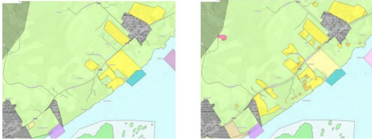
Gjeldene plan til venstre

Planen foreslår flere nye områder for bebyggelse og anlegg, boligbebyggelse og kombinert bebyggelse og anleggsformål (K1).