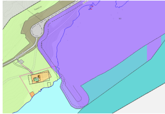
Figur 4: Foreslåtte endringer

Det foreslås samtidig følgende endringer i reguleringsbestemmelsene: