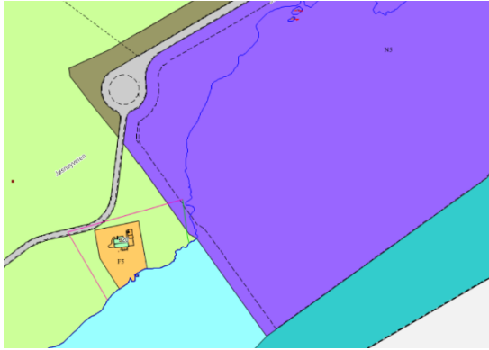
Figur 3: Arealformål i gjeldende reguleringsplan