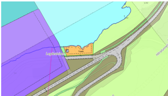
Figur 1: Veikryss i gjeldende reguleringsplan

Hitra kommune søker om mindre endring i plankartet i reguleringsplan for Jøstnøy. Bakgrunnen for denne endringen er at det er ønskelig å legge til rette for en vei fra industriparken over til kysthavna som har bedre svingradius i forhold til store fraktkjøretøy. Samtidig ser kommunen behov for å endre avkjørselen til naustområdet nord i planområdet. Dette for å flytte avkjøringen til dette området vekk fra krysset mellom Kalvøya, Jøsnøya nord og Jøsnøya sør og dermed får et «renere» kryss for trafikkavviklingen. En annen grunn for å flytte denne avkjøringen er på grunn av høydeforskjellen, som vil bli mindre ved å flytte avkjørselen lengre vest. Endringen innebærer også flytting av deler av turstien «Laksestien».